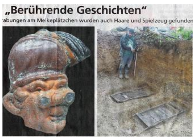
Der Patriot (Lippstadt), 19.06.2020 46